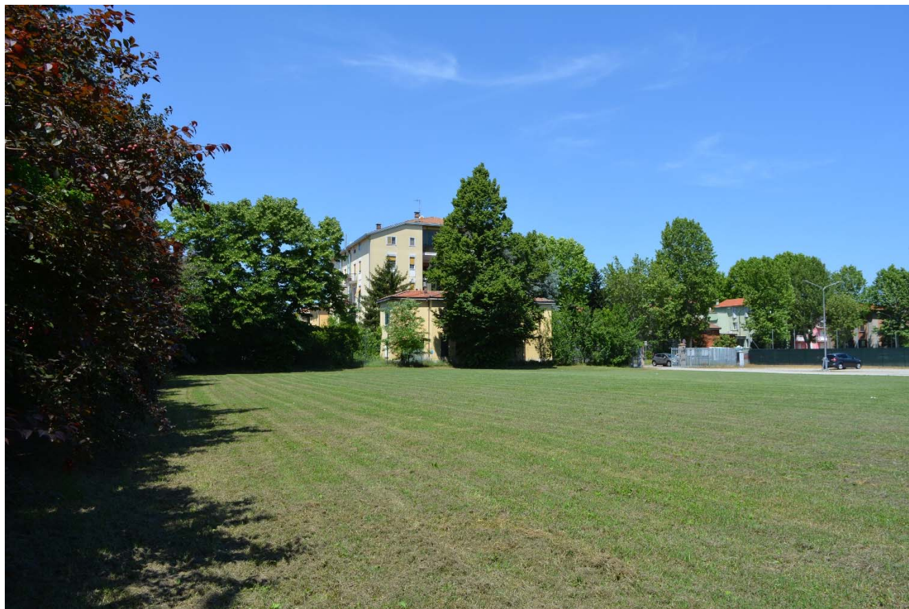
Figura 2 – Area di intervento