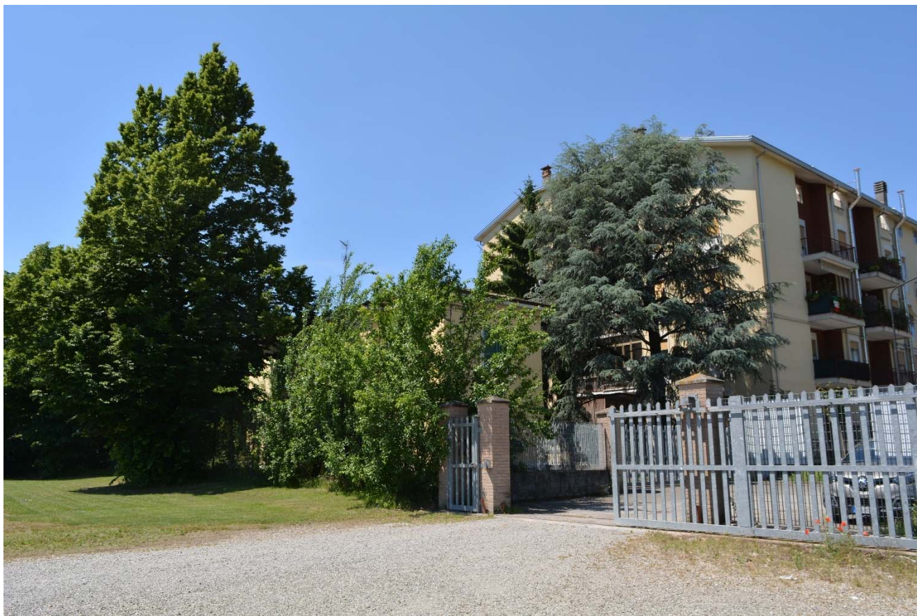
Figura 8 – Area di intervento, vista dell'accesso da via Damiano Chiesa