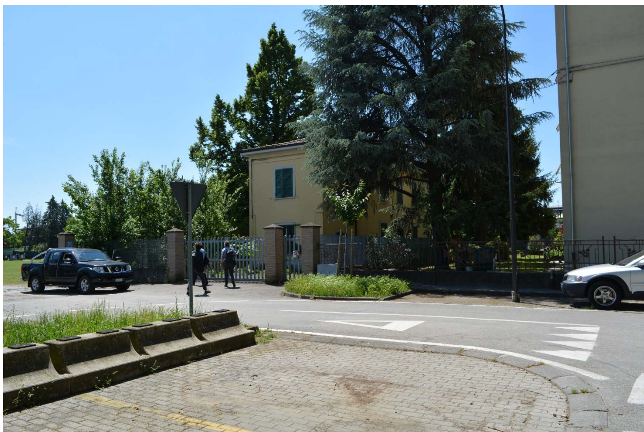
Figura 9 – Area di intervento, vista da via Damiano Chiesa