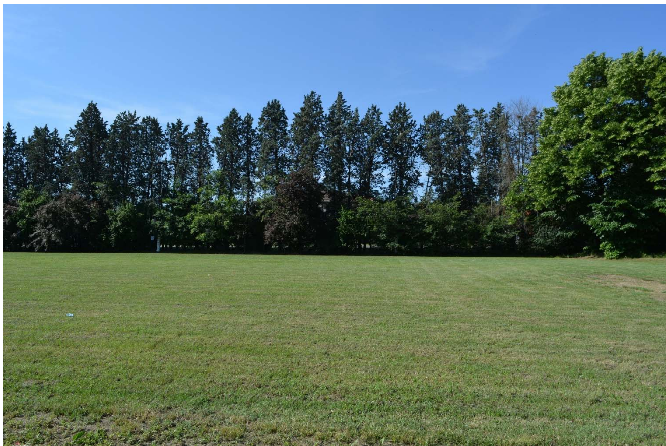
Figura 5 – Area di intervento