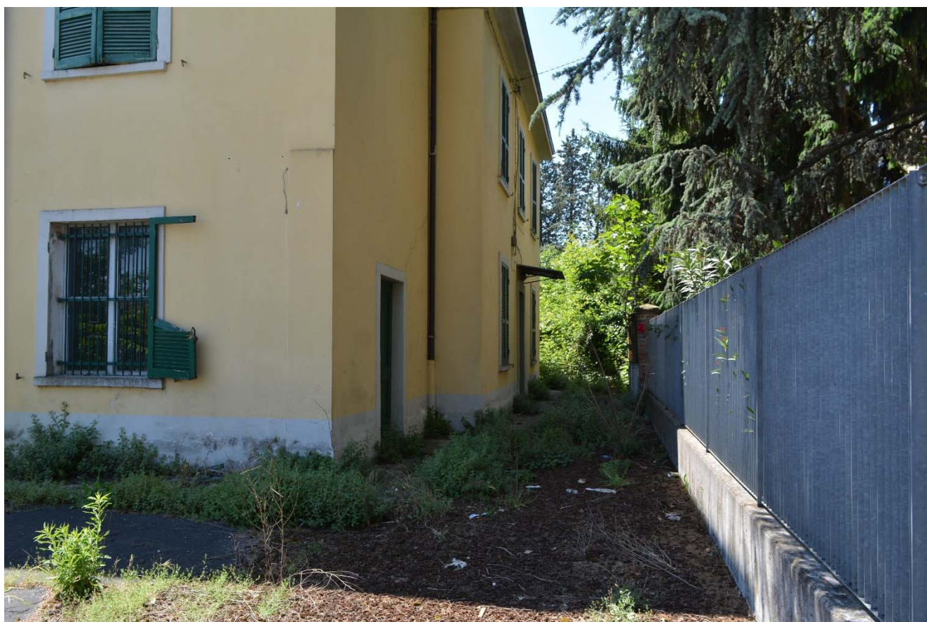
Figura 11 – Area di intervento, vista da via Damiano Chiesa