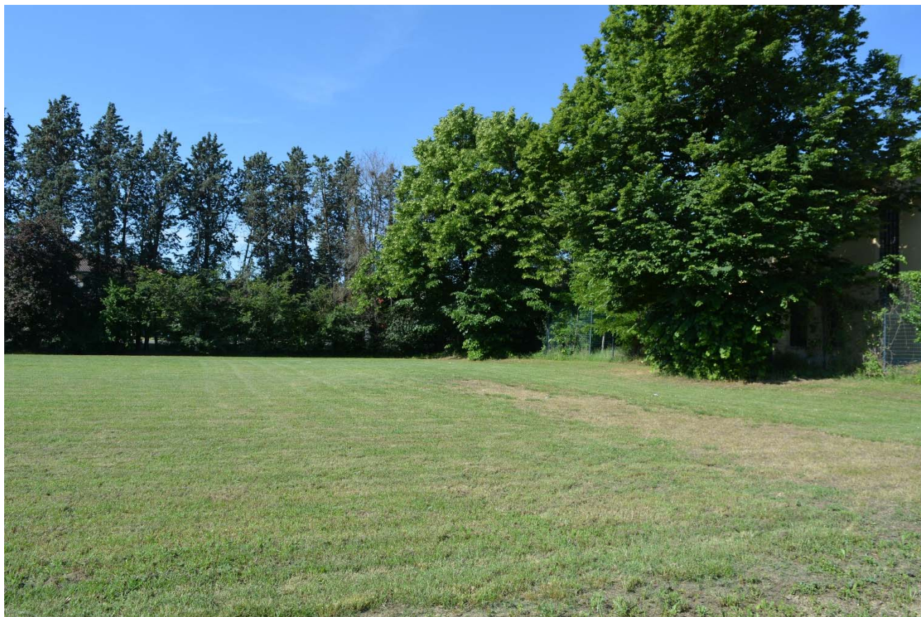
Figura 4 – Area di intervento

R.T.P.: Sinergo Spa E. Sirombo M. Collareda Semper Srl Open Building Spa