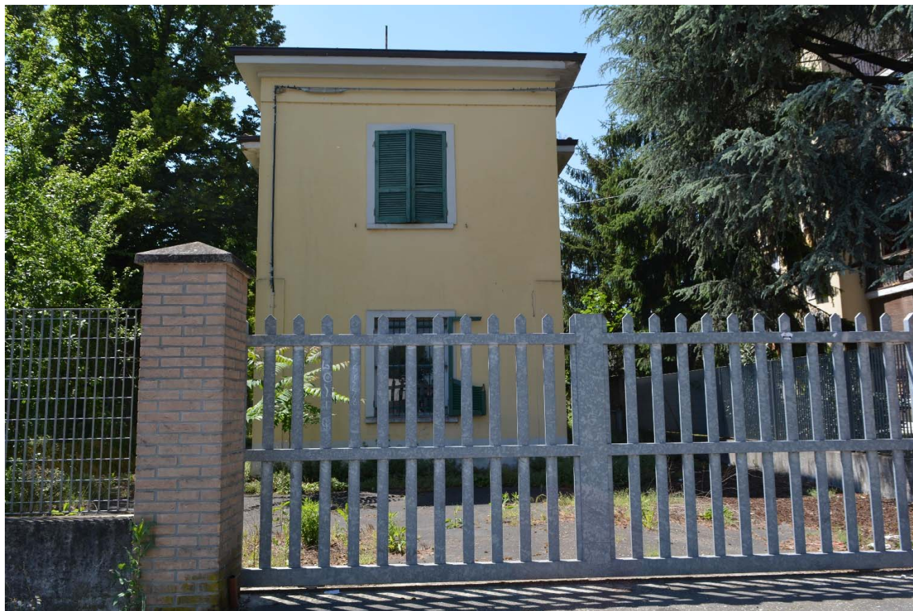
Figura 10 – Area di intervento, vista da via Damiano Chiesa