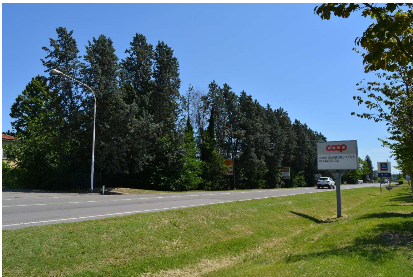
Figura 13 – Via XXIV Maggio