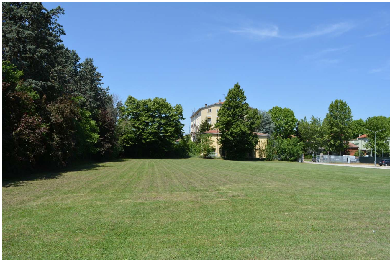
Figura 1 – Area di intervento