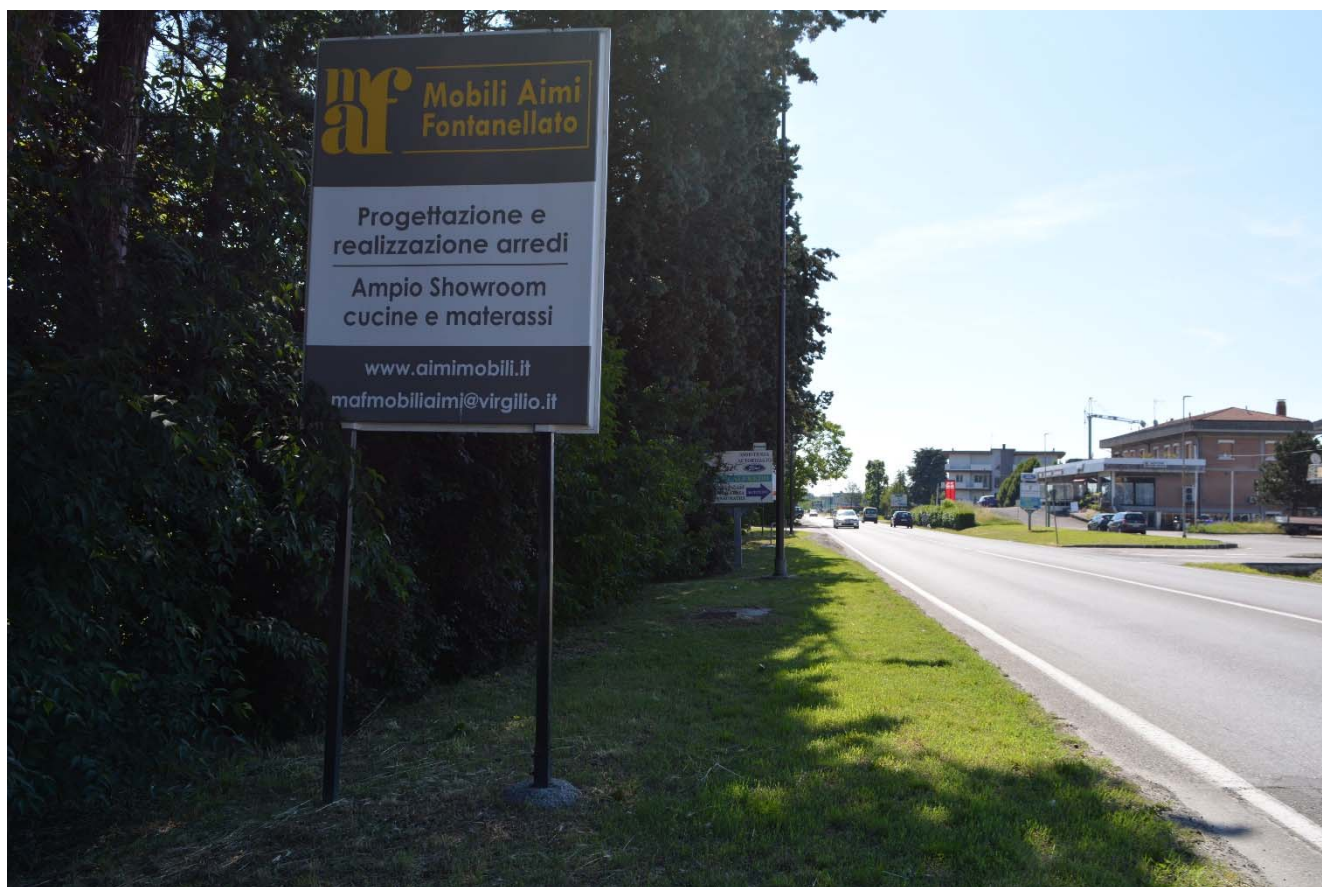
Figura 12 – Via XXIV Maggio

R.T.P.: Sinergo Spa E. Sirombo M. Collareda Semper Srl Open Building Spa