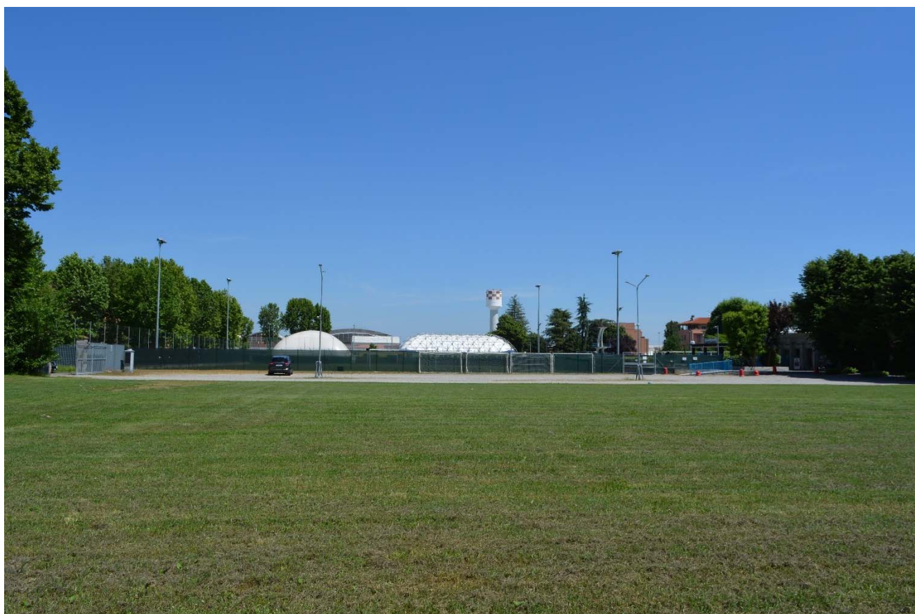
Figura 3 – Vista dall'area di intervento verso l'area piscine