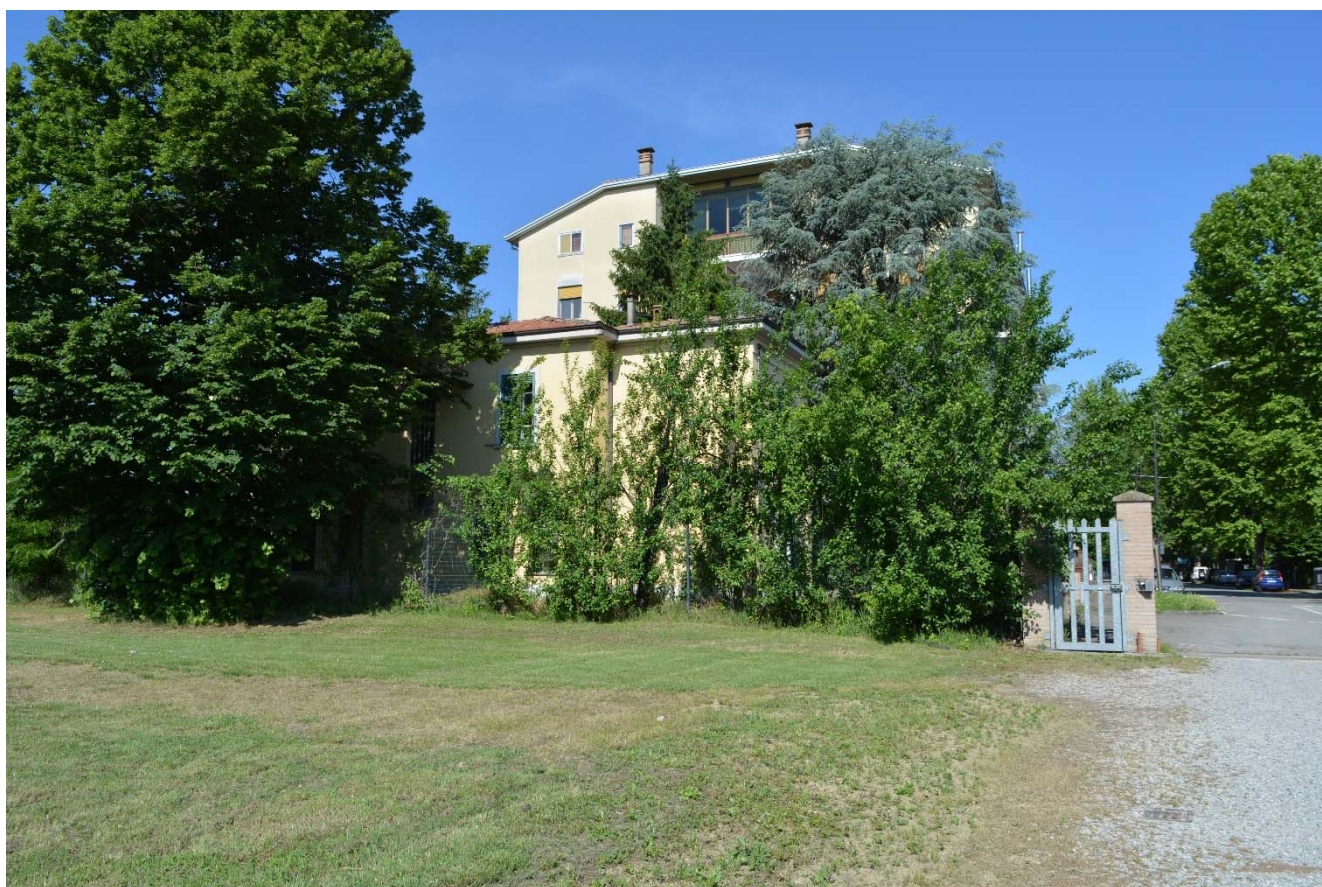
Figura 7 – Area di intervento