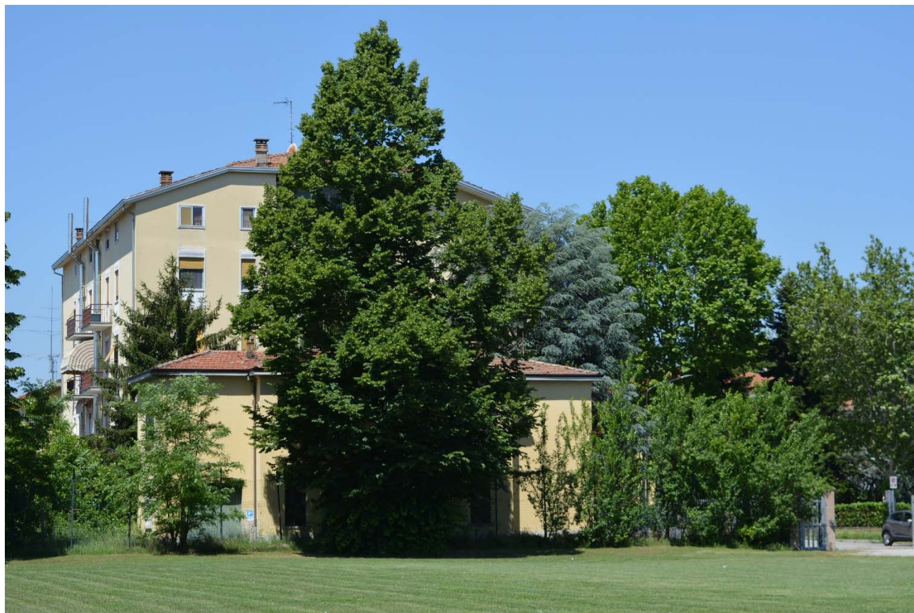
Figura 6 – Area di intervento

R.T.P.: Sinergo Spa E. Sirombo M. Collareda Semper Srl Open Building Spa